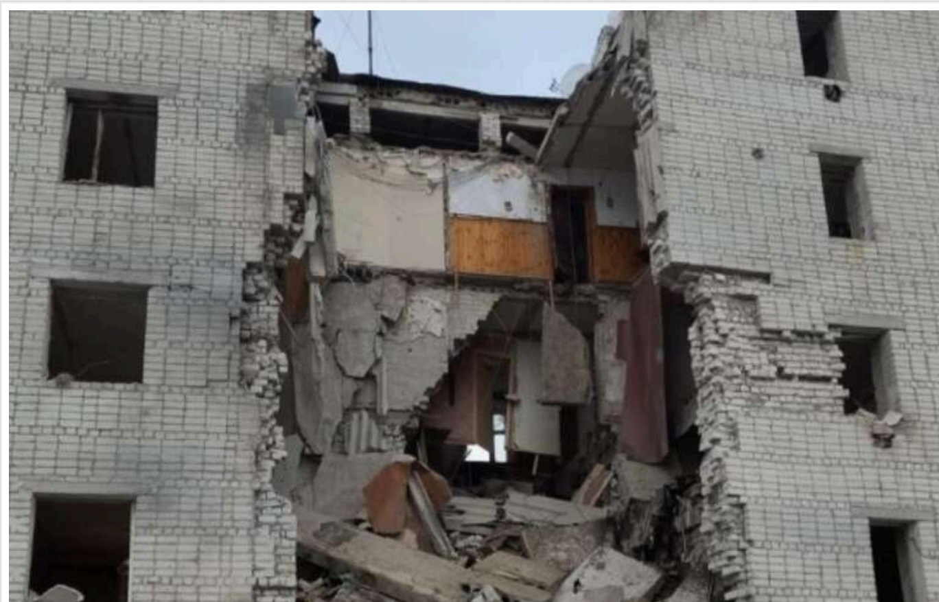
Росіяни завдали авіаудару по багатопверхівці на Сумщині: поранені двоє дітей і дорослий

Сьогодні, 4 січня, російські війська завдали авіаційного удару по Свєтській громаді Шосткинського району, використавши керовану авіабомбу.