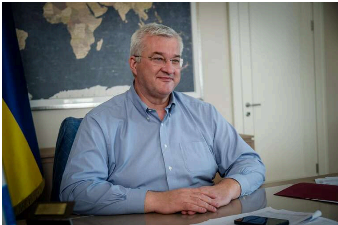
Сибіга провів обговорення з міністром закордонних справ Туреччини щодо безпеки в Чорному морі та ситуації в Сирії

Міністр закордонних справ України Андрій Сибіга провів телефонну бесіду з міністром закордонних справ Туреччини Хаканом Фіданом. Зокрема, вони обговорили питання безпеки в Чорному морі.