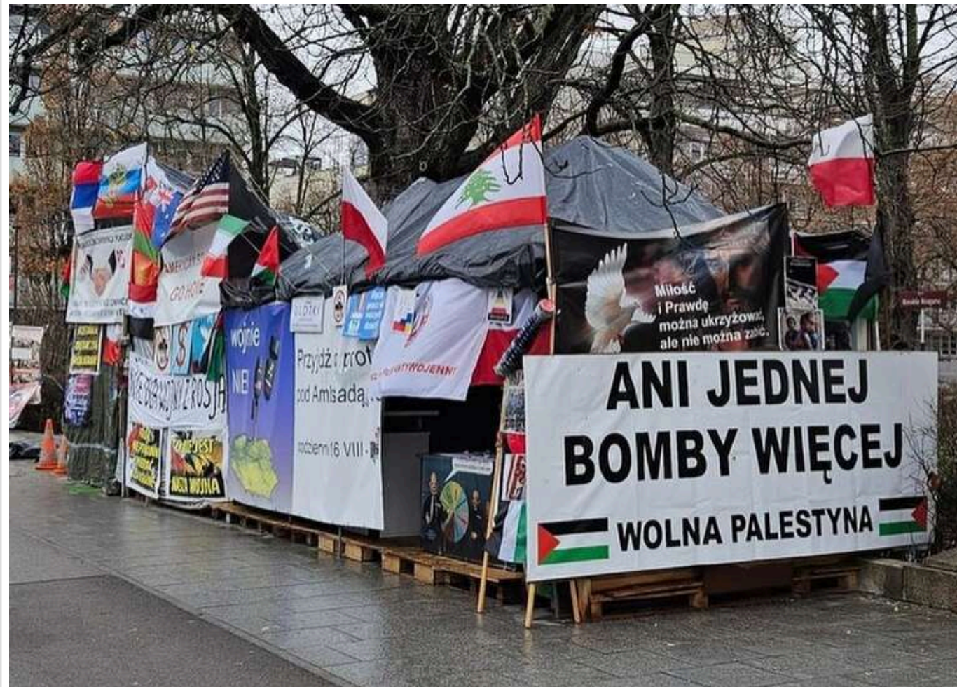
У центрі Варшави ніяк не можуть прибрати проросійську інсталяцію

Уже кілька місяців на Уяздовському проспекті у Варшаві, прямо навпроти посольства США, розташована незвичайна інсталяція. Два намети, прикрашені транспарантами з проросійською риторикою та антизахідними гаслами, включаючи відомий слоган «Це не наша війна», стали місцем постійного протесту.