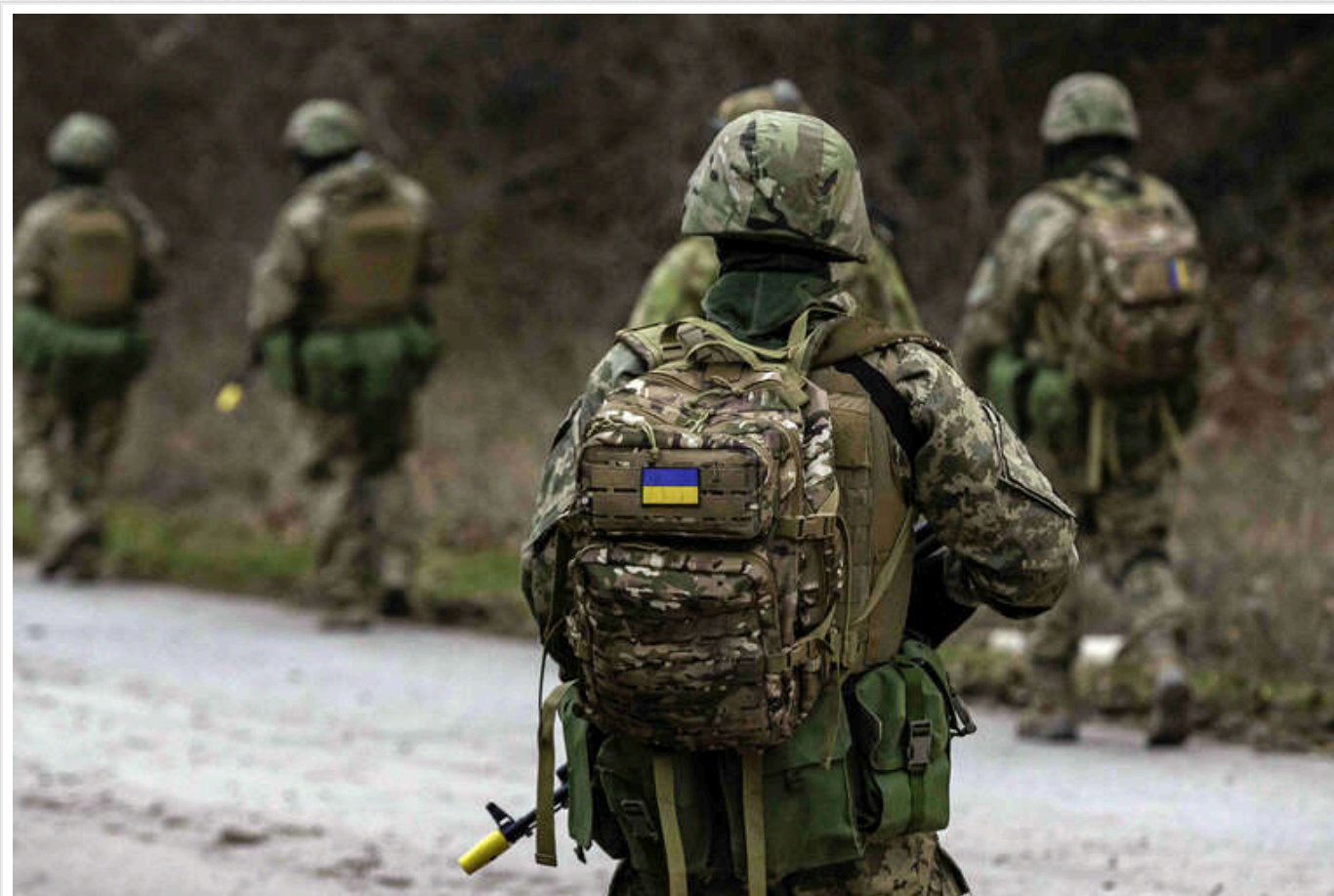
Військові розповіді про тактику російських окупантів під Покровськом

Російські сили поблизу Покровська намагаються проникати малими групами, проте уникають міських сутічок.