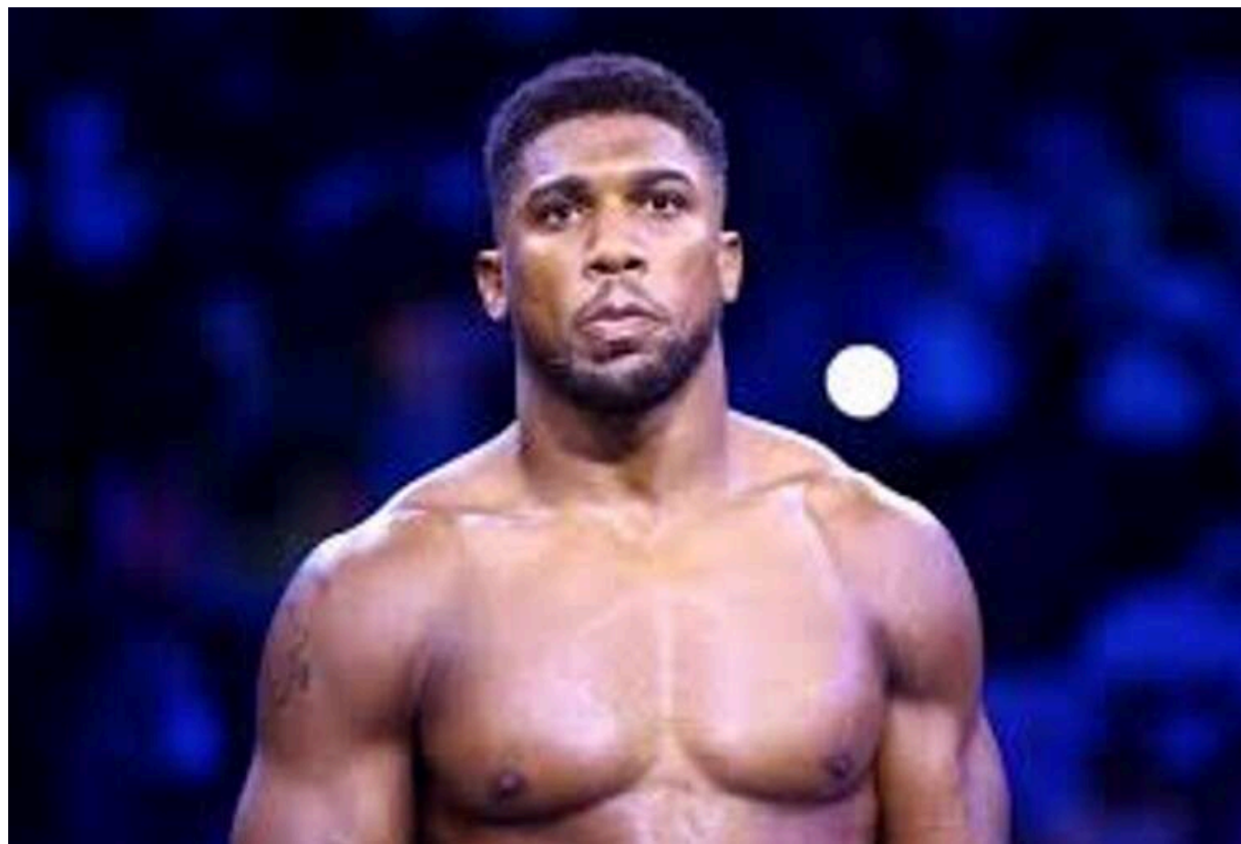
Ексемпціон у надважкій вазі Джошуа висунув "ультиматум" Тайсону Ф'юрі

Ексемпціон світу в суперважкій вазі Ентоні Джошуа (28-4, 25 КО) оголосив, що його поєдинок з Тайсоном Ф'юрі (34-2-1, 24 КО) обов'язково має відбутися до кінця 2025 року. ЕйДжей зізнався, що має намір використати кожну можливість, яка йому трапиться, аби повернутися на ринг.