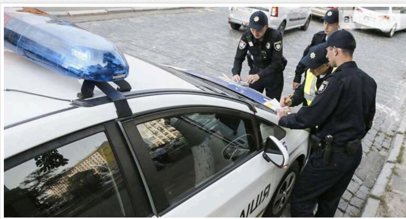
В Нацполіції спростували інформацію про перевірку автоцивілки за допомогою камер

В Україні з 1 січня 2025 року перестануть реєструвати відсутність поліса автоцивілки за допомогою відео- та фотофіксації. Штрафи в розмірі 425 грн за відсутність поліса автоцивілки передбачені законом, але перевірка наявності автострахування за допомогою камер не буде здійснюватись.