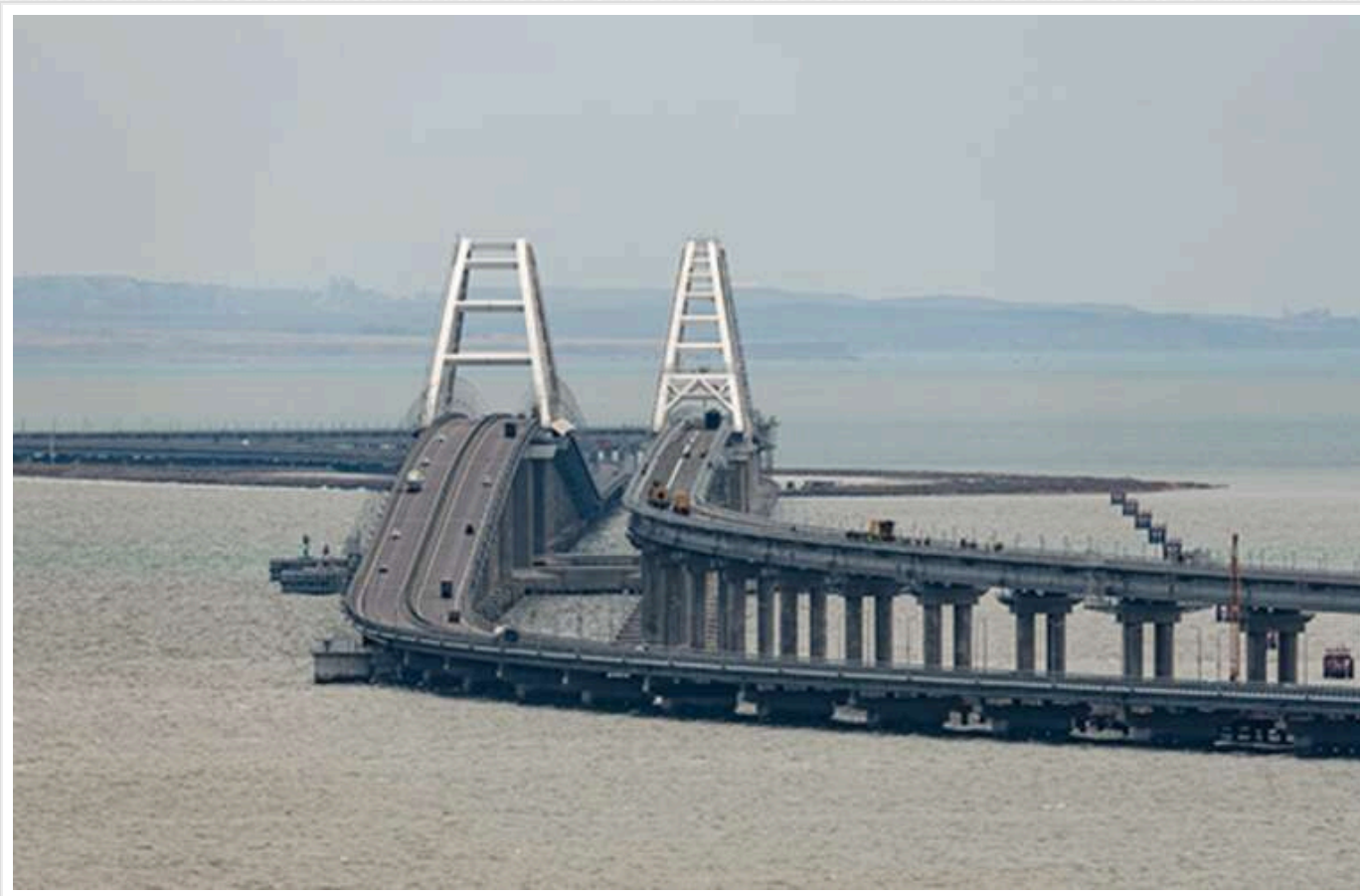
Окупанти біля Керченського мосту втратили майже половину загороджень із барж

Росія в Криму за місяць втратила 16 барж.