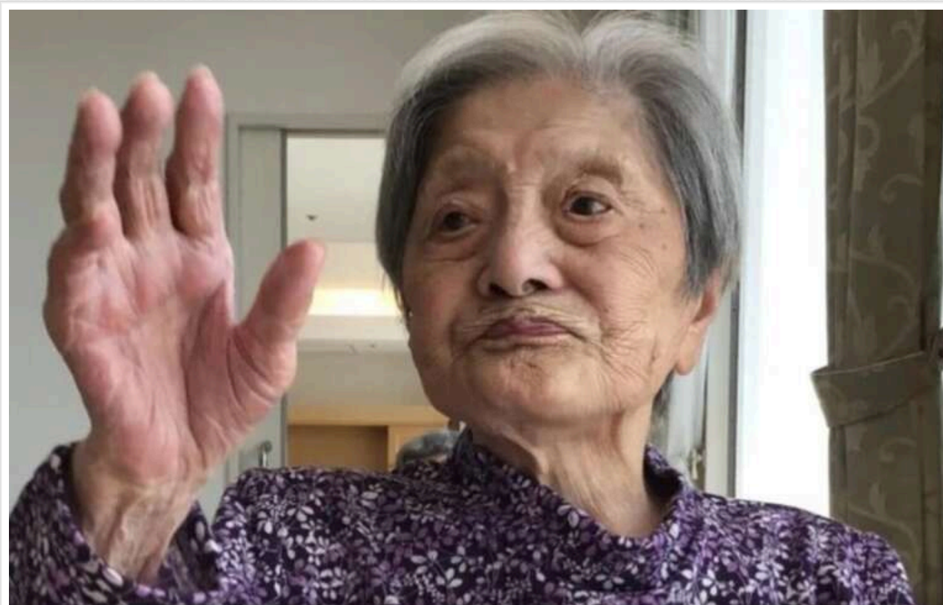
У Японії померла жінка у віці 116 років, яку вважали найстарішою людиною у світі

Томіко Ітоока стала найстарішою живою людиною в Японії в грудні 2023 року.