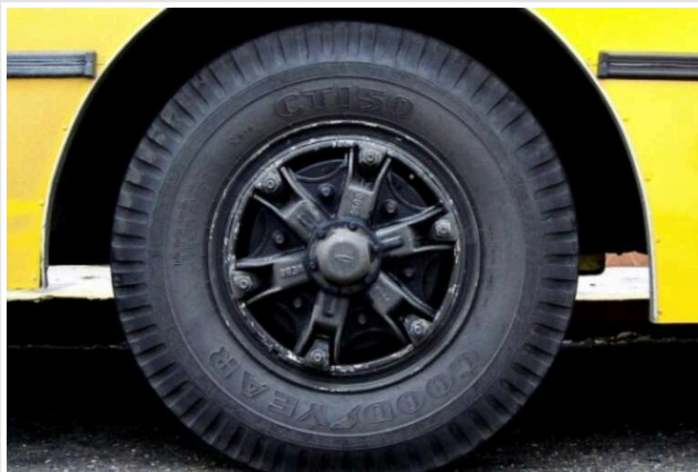
У Харківській області з двох напрямків евакуювали ще 30 осіб – ОВА

Учора, 3 січня, на Харківщині в рамках посилення заходів з евакуації з Куп'янського та Борівського напрямків евакуювали ще 30 осіб, серед яких – одна дитина.