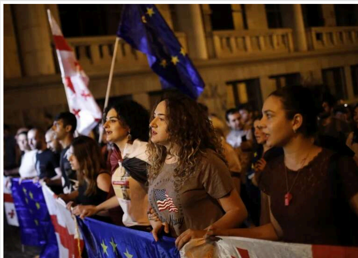
Іноземці, які брали участь в акціях протесту, депортують з Грузії

З Грузії почали депортувати іноземців, які брали участь у прозахідних акціях протесту. Їх звинуватили в адміністративних правопорушеннях.