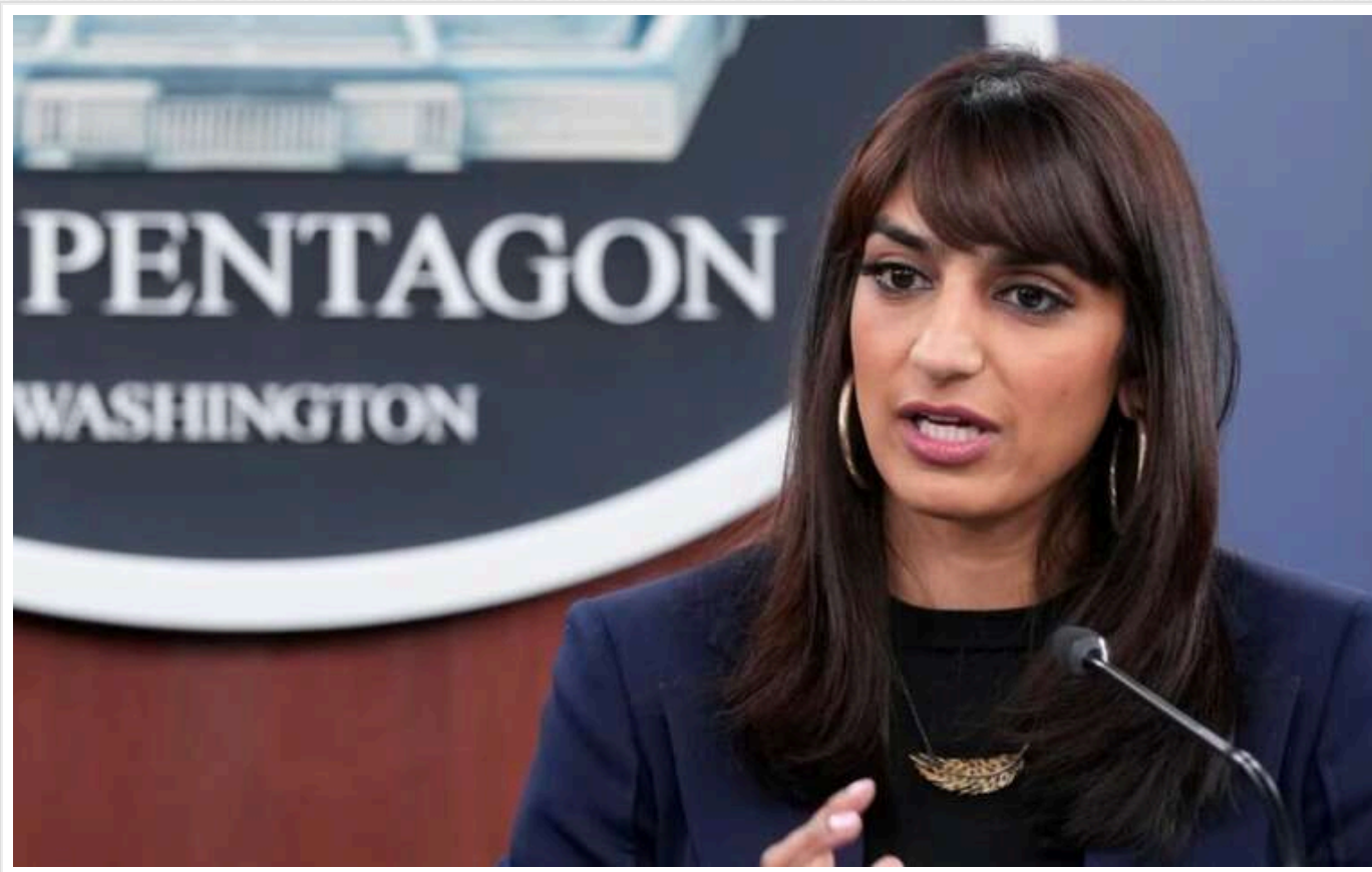
США не зможуть поставити Україні всю допомогу до 20 січня, – Сабріна Сінгх

Речниця Пентагону Сабріна Сінгх заявила, що Сполучені Штати не зможуть завершити постачання військової допомоги Україні до 20 січня, коли можливе завершення поточної адміністрації. За її словами, передача обладнання здійснюється поступово, що пов'язано з логістичними обмеженнями та процедурою зняття техніки зі складів.