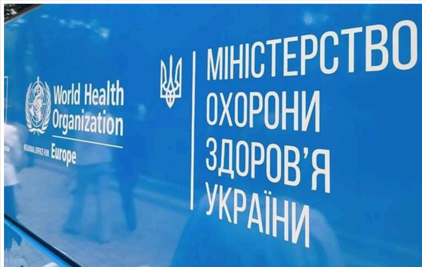
Міністерство охорони здоров'я замовило ремонт у компанії, яка фігурує в семи кримінальних справах про розкрадання державних коштів

Антимонопольний комітет виніс вирок ТОВ «ДСЗ» і ПП «Нікопольгазбуд» за змову під час участі у торгах, щоб отримати замовлення з Дніпропетровською облдержадміністрацією ще у 2019 році.