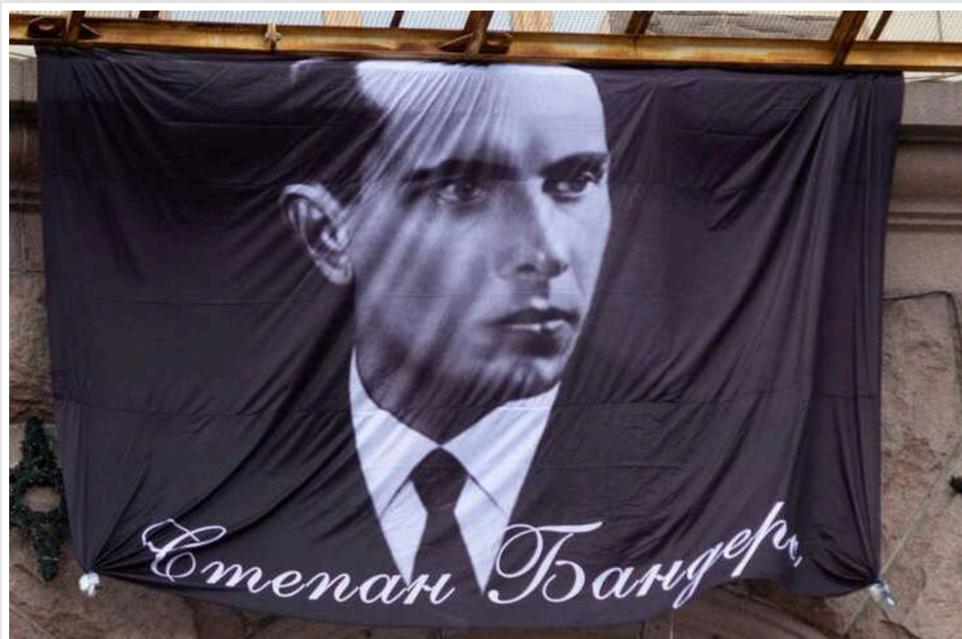
На створення фільму про Степана Бандеру планують виділити 24 мільйони гривень

З державного бюджету виділять 24 млн гривень на створення нового фільму про Степана Бандеру, згідно з інформацією з тендеру на Prozorro.