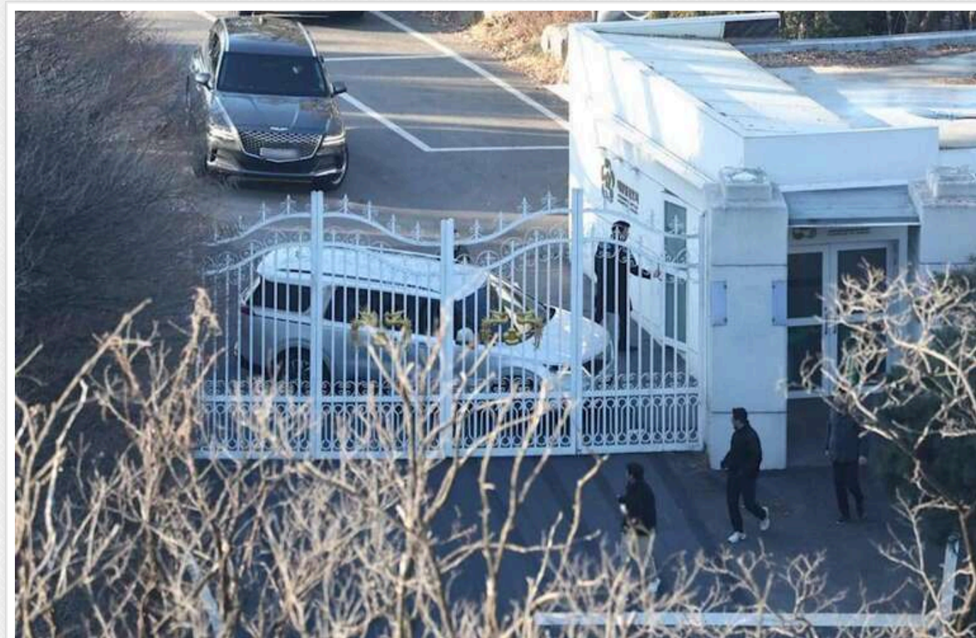
Юн Сок Йоль сховався від арешту в президентському палаці

Президент Південної Кореї Юн Сок Йоль вирішив сховатися від арешту в президентському палаці.