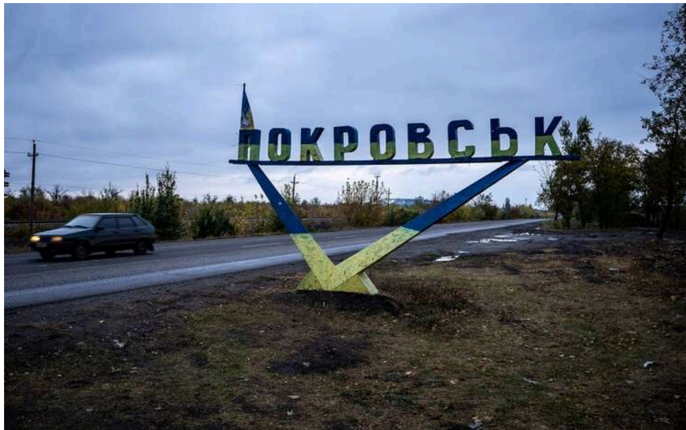
В Покровську залишилися тільки солдати ЗСУ та власники магазинів

ЗС РФ давно розглядає це суворе промислове місто як стратегічну мету. Шахти Покровська добувають вугілля, життєво важливе для сталеливарної промисловості України, залізничні та автомобільні дороги роблять його ключовим транспортним вузлом.