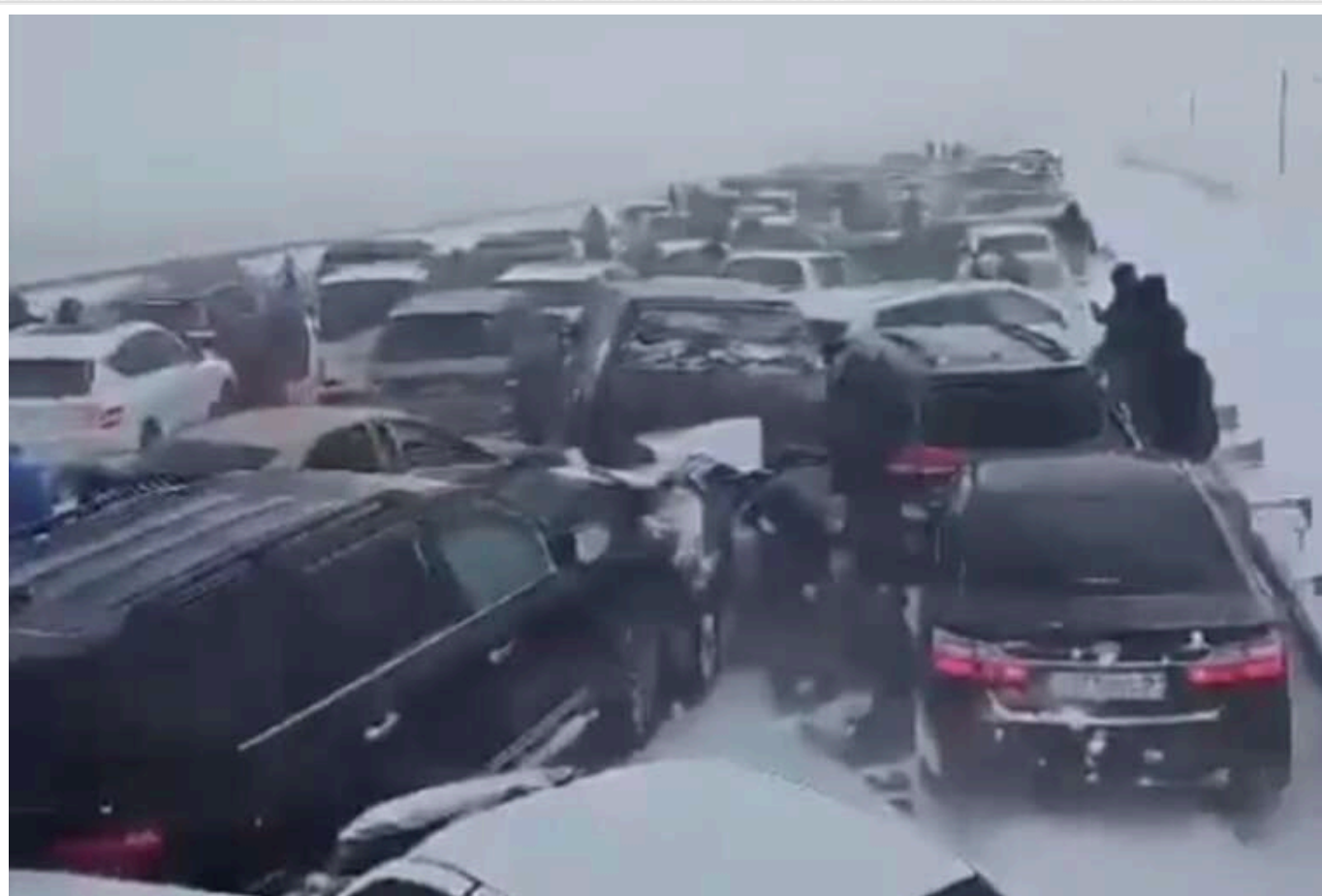
На трасі в Казахстані майже 100 машин зіткнулися через негоду

Сніжна буря та ожеледиця у перші дні нового року створили аварійні умови на дорогах Казахстану. Водії перевищували швидкісний режим і не дотримувалися безпечної дистанції, що призвело до зіткнення на трасі "Астана – Щучинськ".