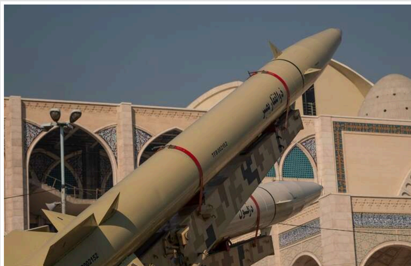
Ізраїль провів масштабний рейд на іранський ракетний завод у Сирії

Повітряні сили Ізраїлю розповіли подробиці про одну з їхніх найсміливіших і найскладніших операцій спецназу, під час якої у вересні 120 бійців спеціальних підрозділів здійснили рейд і знищили підземний іранський завод з виготовлення ракет у Сирії. Операція була успішно проведена елітним підрозділом Повітряних сил Ізраїлю "Шальдаг" у співпраці з пошуково-рятувальним загonom 669.