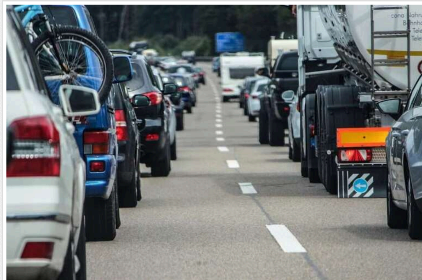
На кордоні України та Польщі утворилися черги

Опівдні 3 січня в більшості пунктів пропуску на українському кордоні не спостерігається черг транспорту. Там, де все ж наявні черги, вони значні – до 80 легкових авто (зокрема, на кордоні з Польщею). Водночас у багатьох пунктах здійснюється пропуск лише транспорту – пішоходів не пропускають. Найбільше таких пунктів - на кордоні з Польщею.