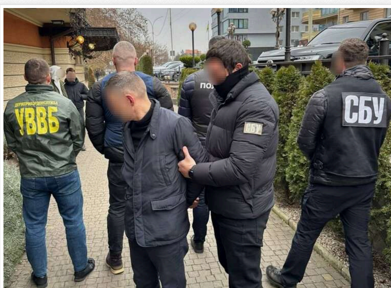
На Закарпатті викрили прикордонника, який допомагав чоловікам виїхати з України

Прикордонник Чопського загону за 6000 доларів допомагав чоловікам призовного віку нелегально перетинати державний кордон з Угорщиною. Порушника затримали офіцери внутрішньої та власної безпеки ДПСУ разом зі співробітниками СБУ.