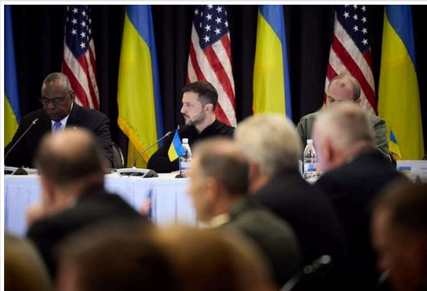
Журналісти повідомили дату проведення наступного засідання "Рамштайн"

Наступного тижня відбудеться нове засідання з питань оборони України в форматі "Рамштайн". Засідання заплановане на 9 січня.