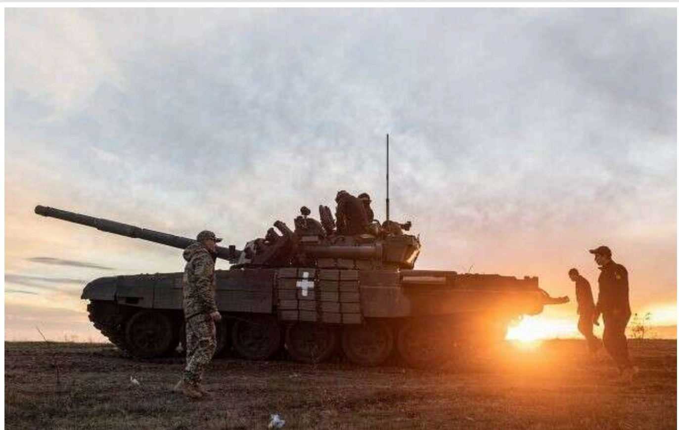
ОСУВ "Хортиця": В Харківській області ворог зруйнував деякі позиції ЗСУ

За минулу добу, 2 січня, окупанти проводили штурмові дії на Харківському та Куп'янському напрямках, що призвело до руйнування деяких позицій Збройних сил України (ЗСУ).