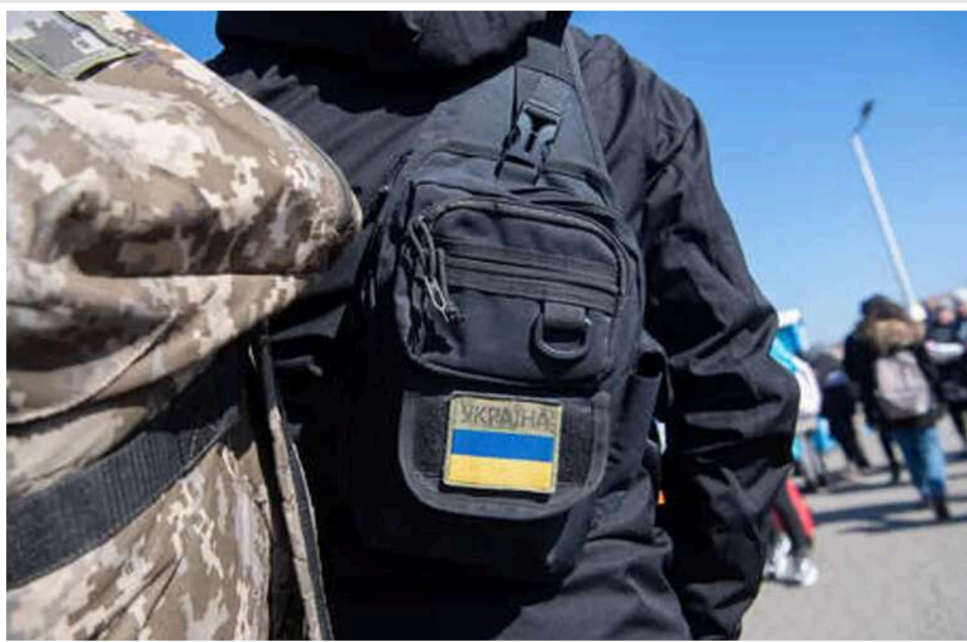
У Польщі українські чоловіки почали отримувати підроблені повістки

Українські чоловіки в Польщі почали отримувати фальшиві повістки.