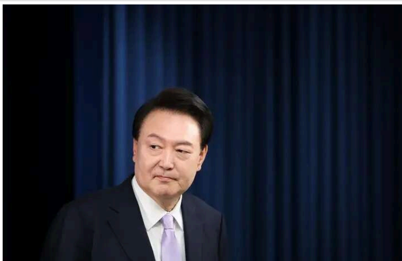
У Південній Кореї призупинили виконання ордеру на арешт президента після 5 годин протистояння з охороною

Південнокорейські слідчі в п'ятницю, 3 січня, ухвалили рішення припинити виконання ордеру на арешт президента країни Юн Сок Йоля через неможливість виконання після більш ніж п'ятигодинного протистояння з президентською охороною.