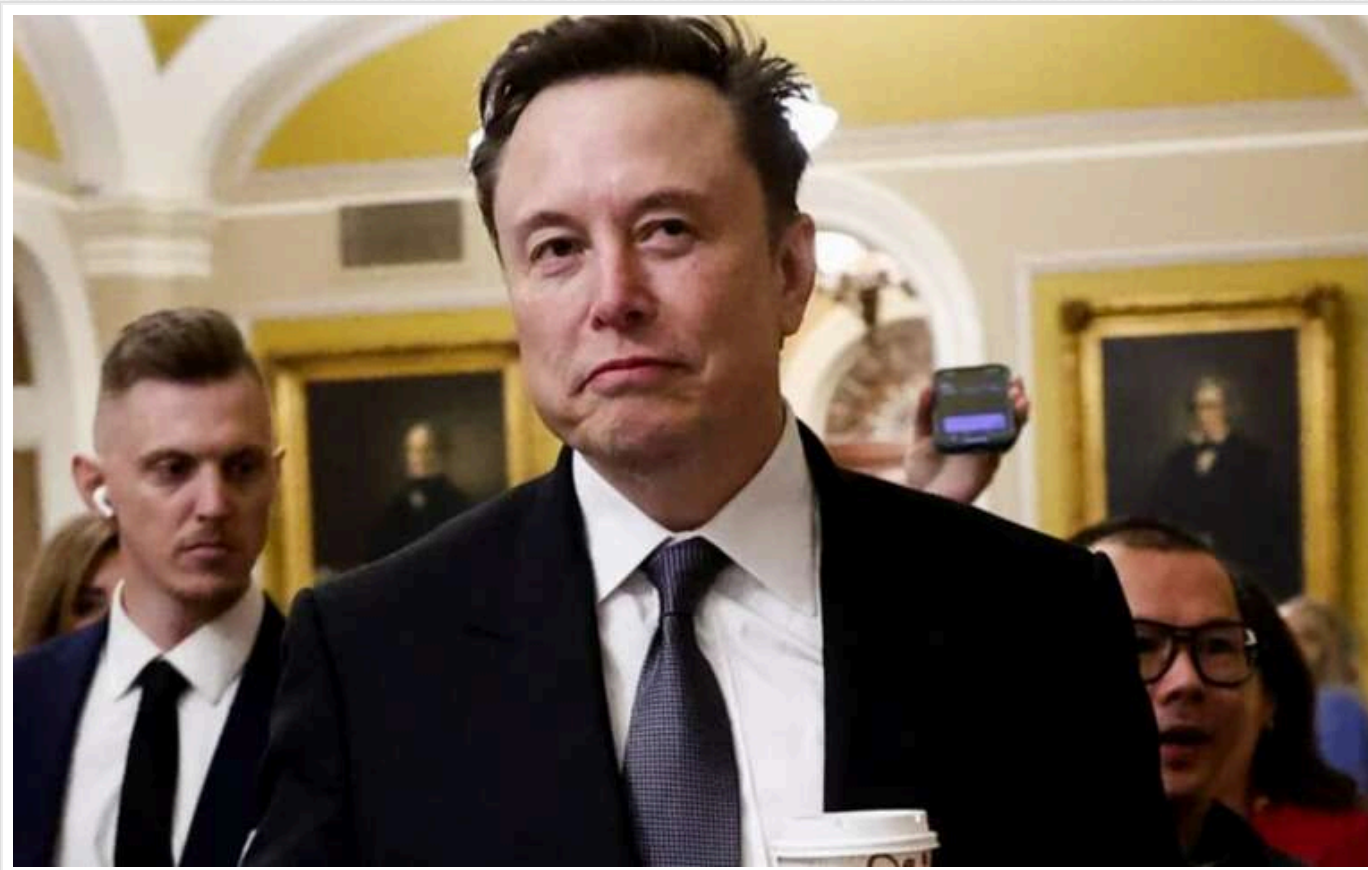
Ілон Маск розкритикував прем'єр-міністра Британії Стармера і закликав до виборів

Ілон Маск виступив із різкою критикою на адресу прем'єр-міністра Великобританії Кіра Стармера.