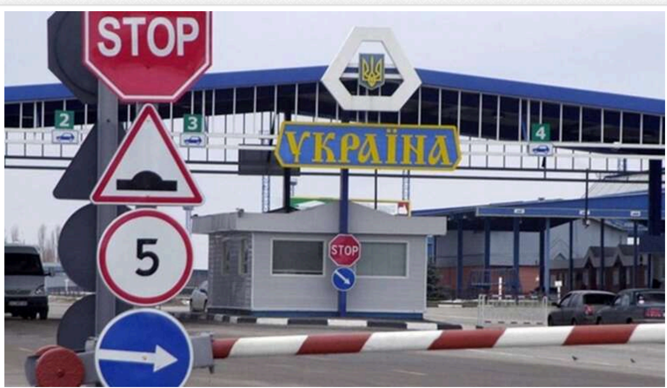
Контрабандні потоки під контролем СБУ: Кузник і Тимошук домовилися про нові схеми на митниці