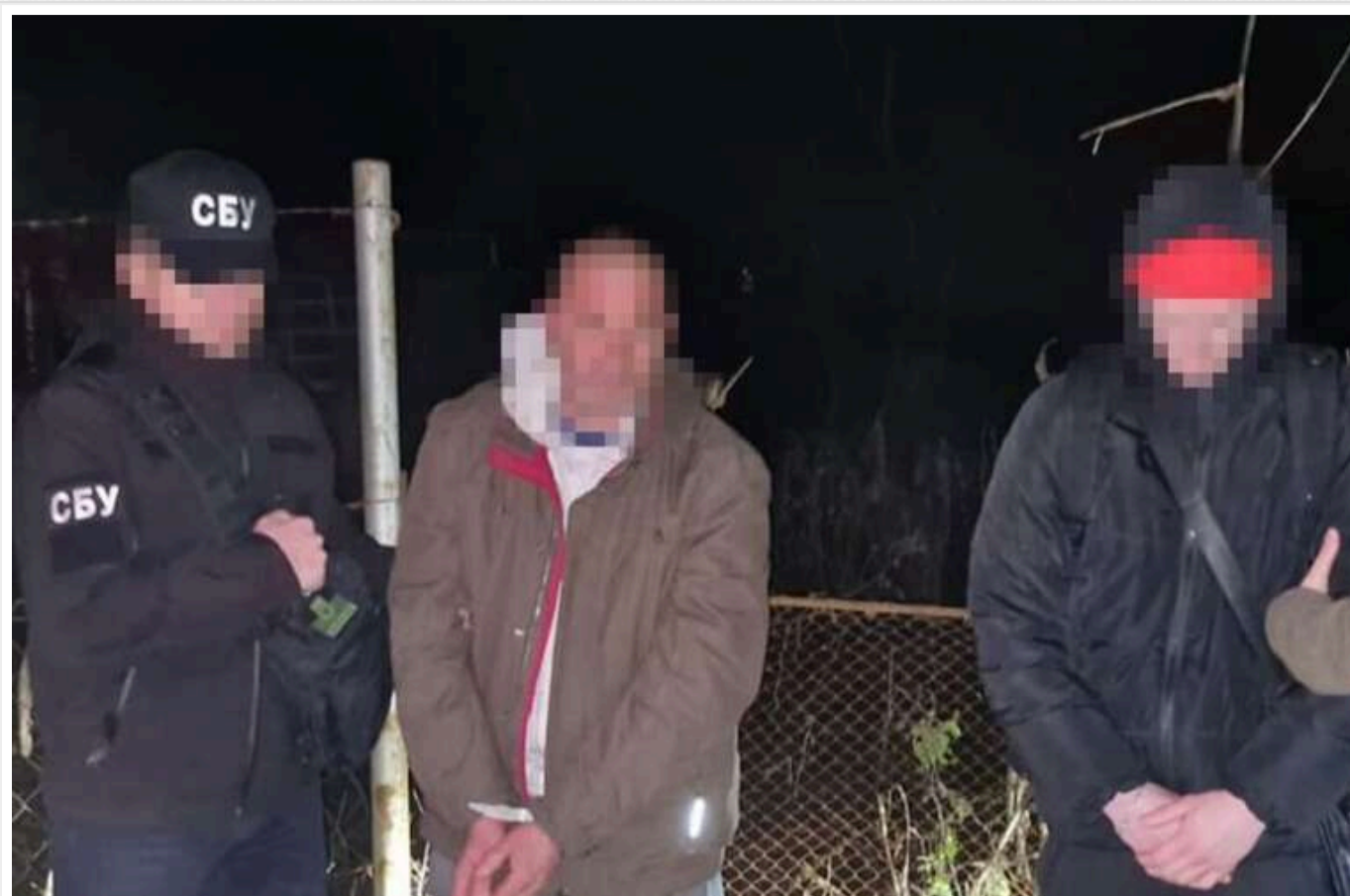
Правоохоронці ліквідували три нові схеми для ухилянтів на заході й півдні України

Працівники Служби безпеки України та Національної поліції викрили нові схеми уникнення від мобілізації, що діяли в західних і південних регіонах країни. У результаті комплексних заходів затримано шістьох організаторів цих махінацій.