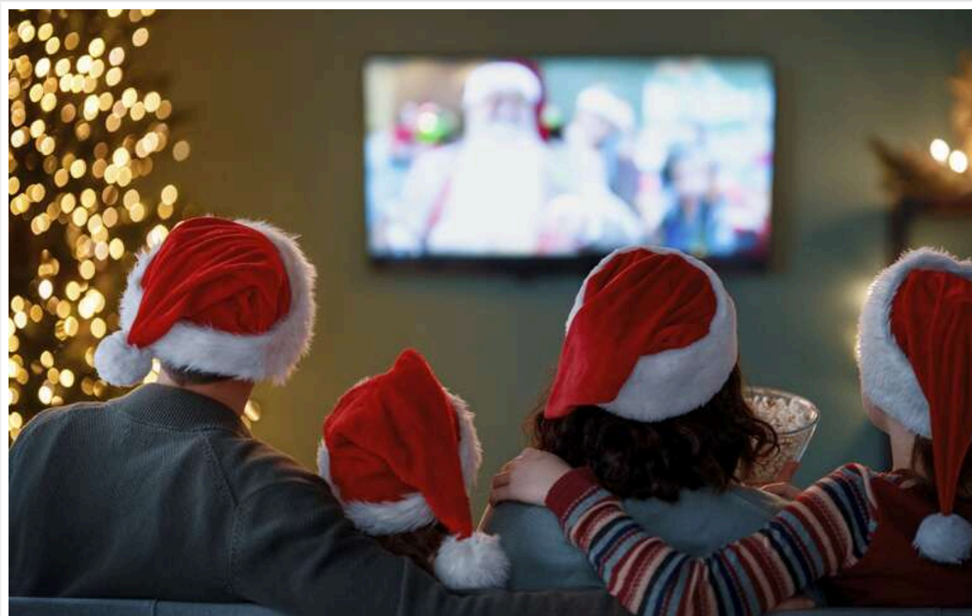
У новорічну ніч низка телеканалів не увімкнула державний гімн

ICTV2 замість гімну транслював «Дизель-шоу», а ТЕТ відразу показав новорічний концерт.