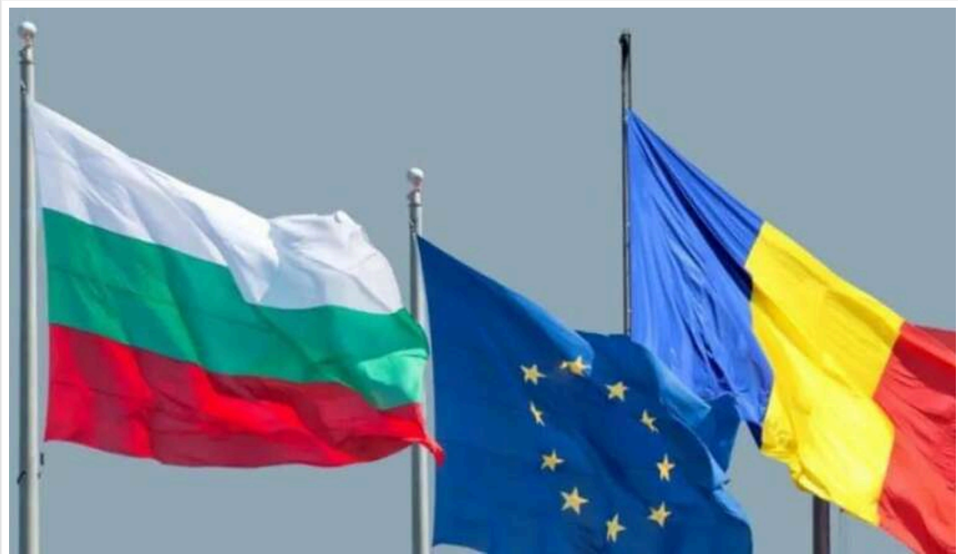
Болгарія та Румунія повноцінно приєдналися до Шенгенської зони

1 січня Румунія та Болгарія приєдналися до Шенгенської зони, скасувавши прикордонні перевірки з іншими країнами ЄС.