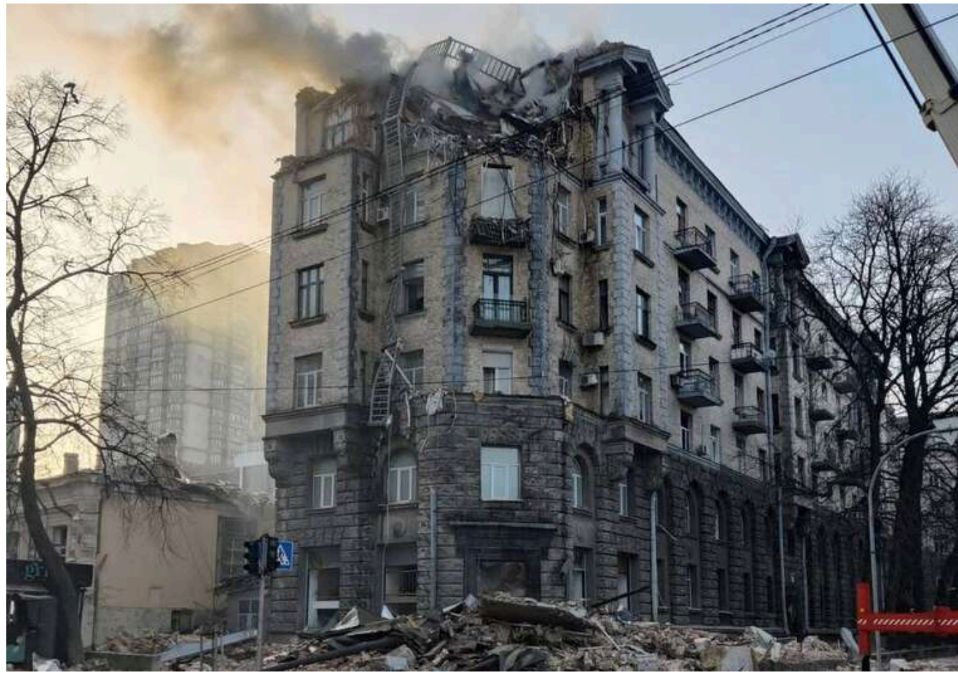
Атака "шахедів" на Київ: який має вигляд зруйнований будинок в центрі столиці

Вид на «будинок Раднаркому» в центрі Києва, зруйнований після сьогоднішньої атаки безпілотників на столицю.