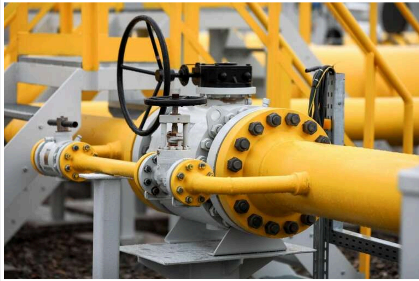
Кінець транзиту російського газу через Україну ставить країни ЄС під удар

Зупинка транзиту російського газу через Україну ставить під загрозу країни ЄС, повідомляє французька газета Le Monde.