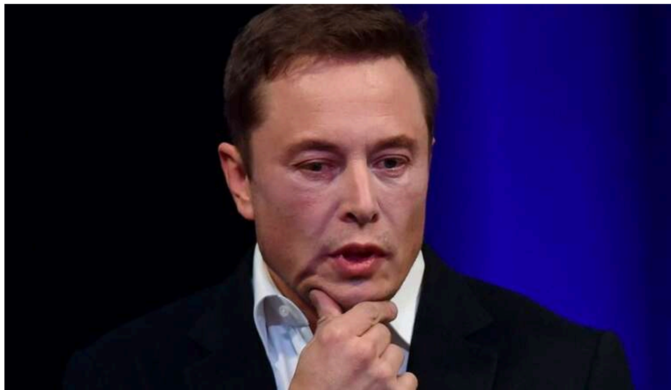
Маск назвав Штайнмаєра "антидемократичним тираном"

Ілон Маск назвав президента Німеччини "антидемократичним тираном".