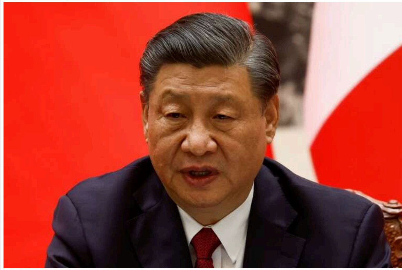
Сі Цзіньпін знову заявив, що ніхто не може зупинити «возз'єднання» Китаю з Тайванем

У телевізійній промові у вівторок лідер КНР Сі Цзіньпін заявив, що жодна країна не може зупинити «возз'єднання» Китаю з Тайванем.