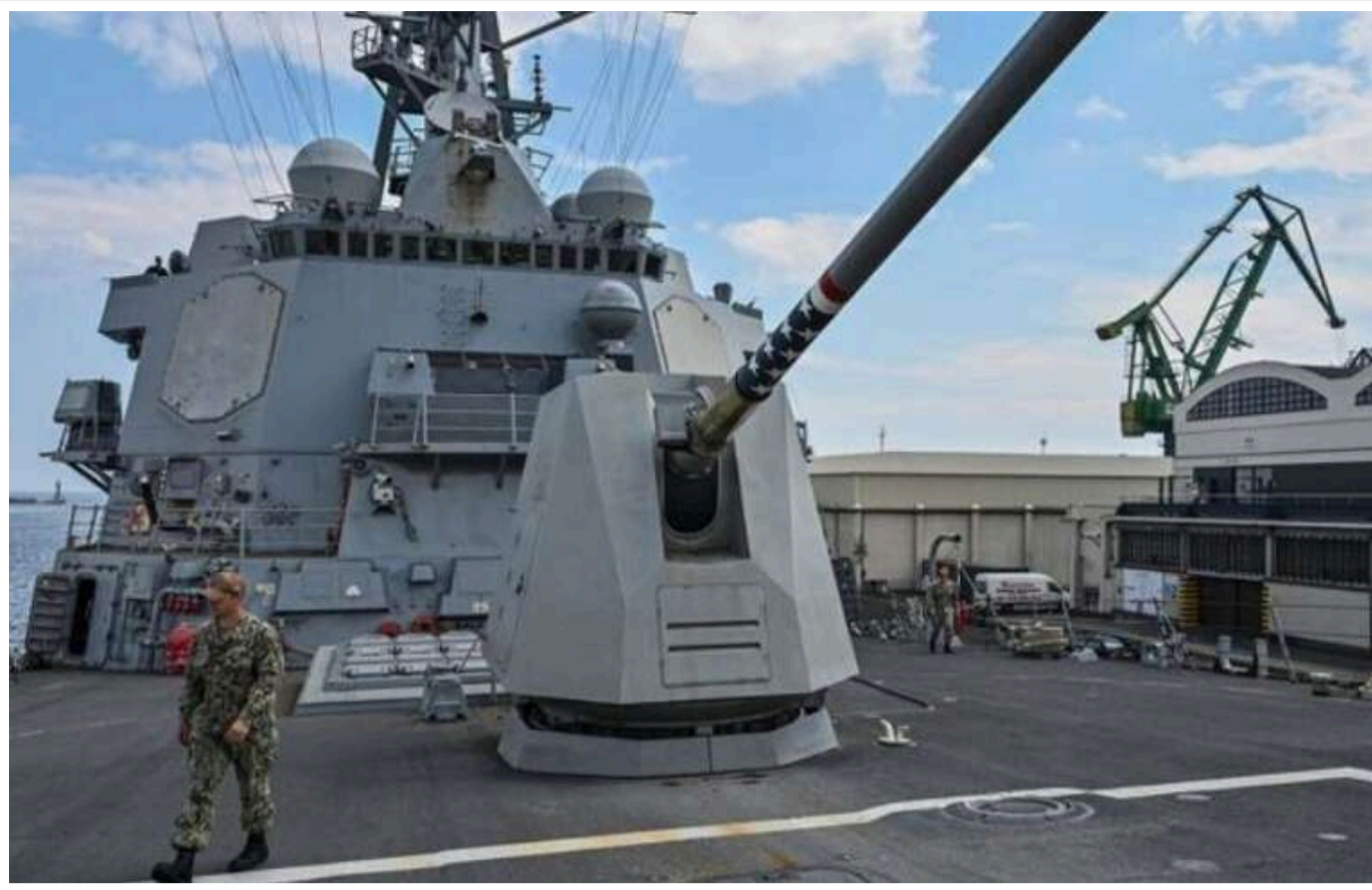
США завдали серію ударів по об'єктах хуситів у Ємені

Військово-морські та повітряні сили США завдали серію високоточних ударів по ключових об'єктах хуситів у Ємені, яких підтримує Іран.