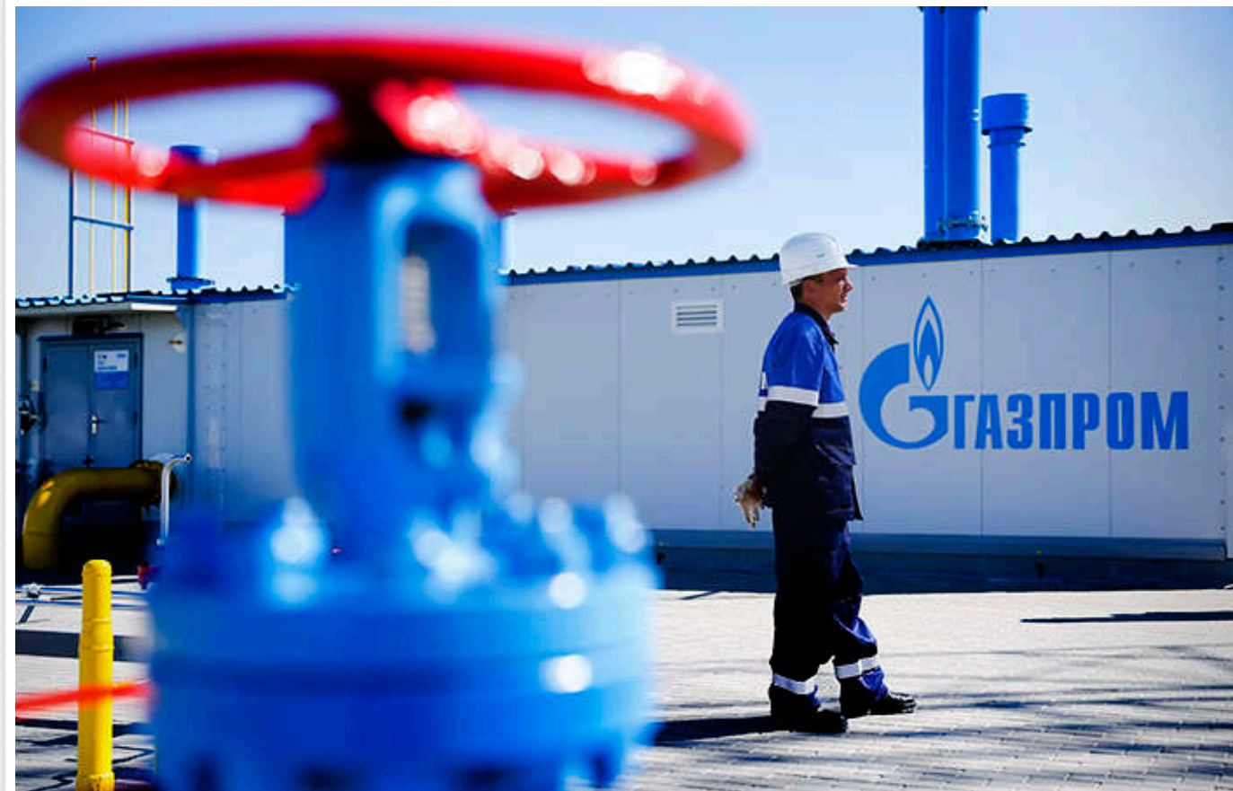
Російський "Газпром" офіційно підтвердив припинення транзиту газу через територію України

За заявою компанії, транзит зупинений через "відсутність технічної та юридичної можливості постачати газ".