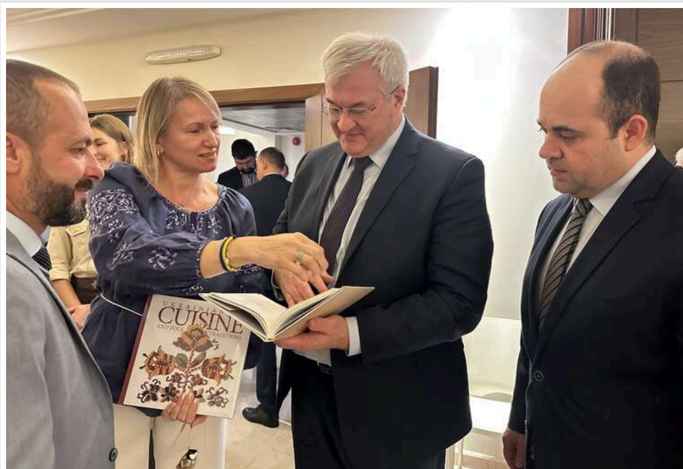
Україна та Ліван посилять співпрацю у сфері кібербезпеки

Міністр закордонних справ України Андрій Сибіга відвідав Ліван. У рамках його візиту відбулася низка зустрічей.