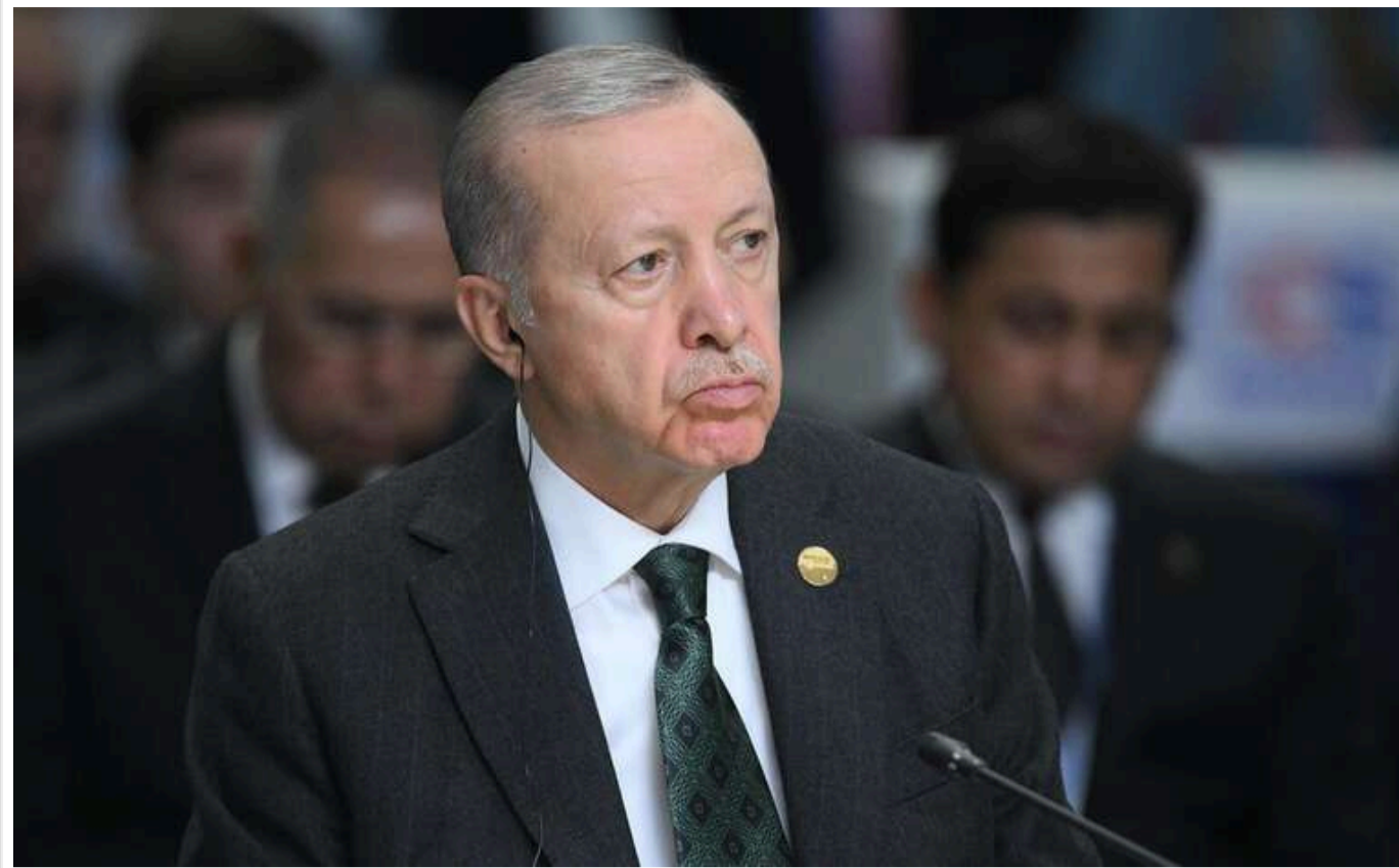
Ердоган: У 2025 році пріоритетом Туреччини стане завершення війни в Україні

Президент Туреччини Рейсеп Тайїп Ердоган оголосив про важливість завершення війни в Україні як пріоритет для Стамбула у 2025 році.