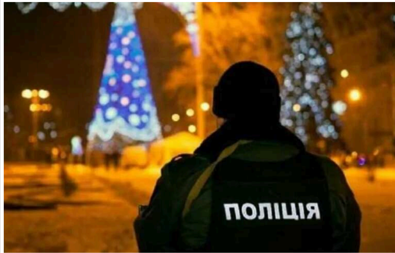
Усіх порушників комендантської години в новорічну ніч затримуватимуть і доставлятимуть до відділків, - Нацполіція

У Національній поліції України заявили, що під час новорічної ночі контроль за дотриманням комендантської години буде максимально посилений. Усіх порушників затримуватимуть та доставлятимуть до відділень поліції для встановлення особи та причин перебування на вулиці під час заборони.