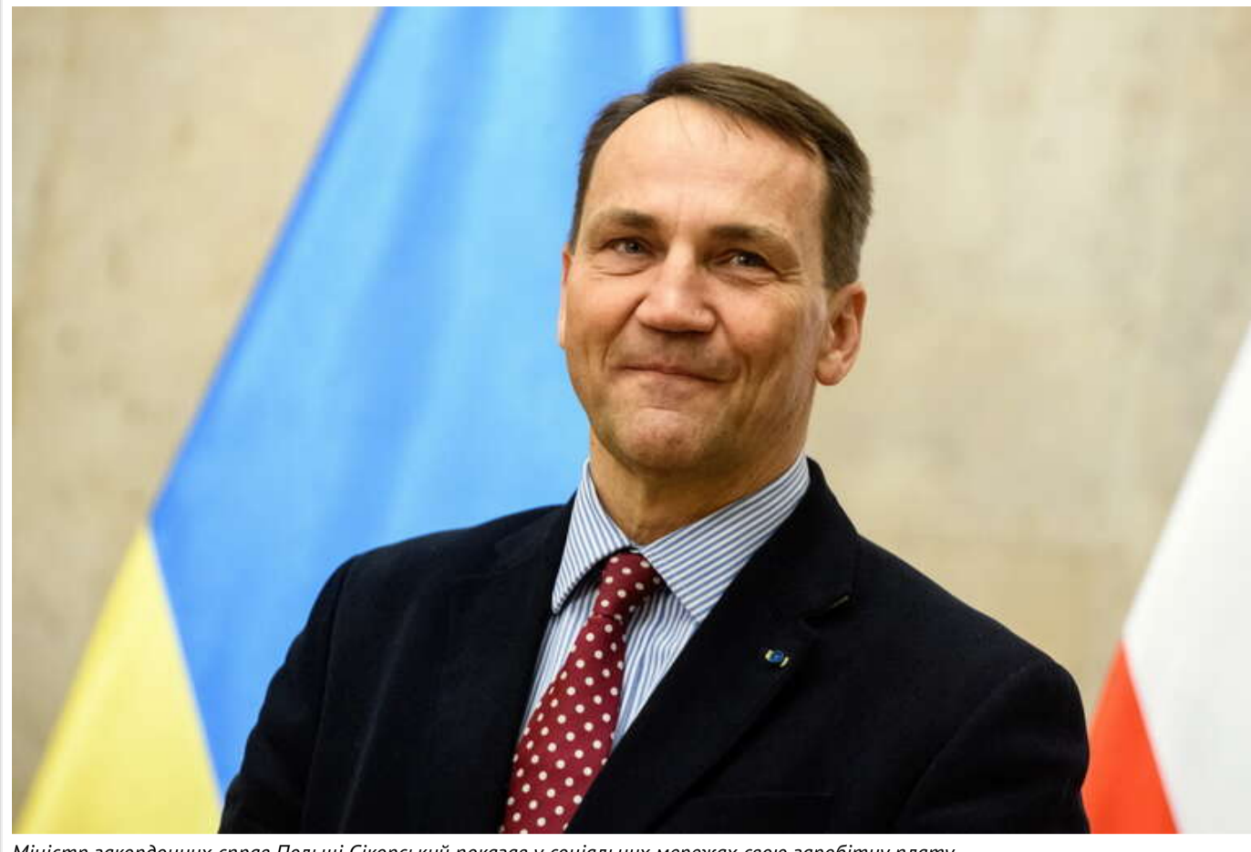
Міністр закордонних справ Польщі Сікорський показав у соціальних мережах свою заробітну плату

Міністр закордонних справ Польщі Радослав Сікорський у своїх соцмережах розкрив інформацію про розмір заробітної плати, яку отримує на цій посаді.