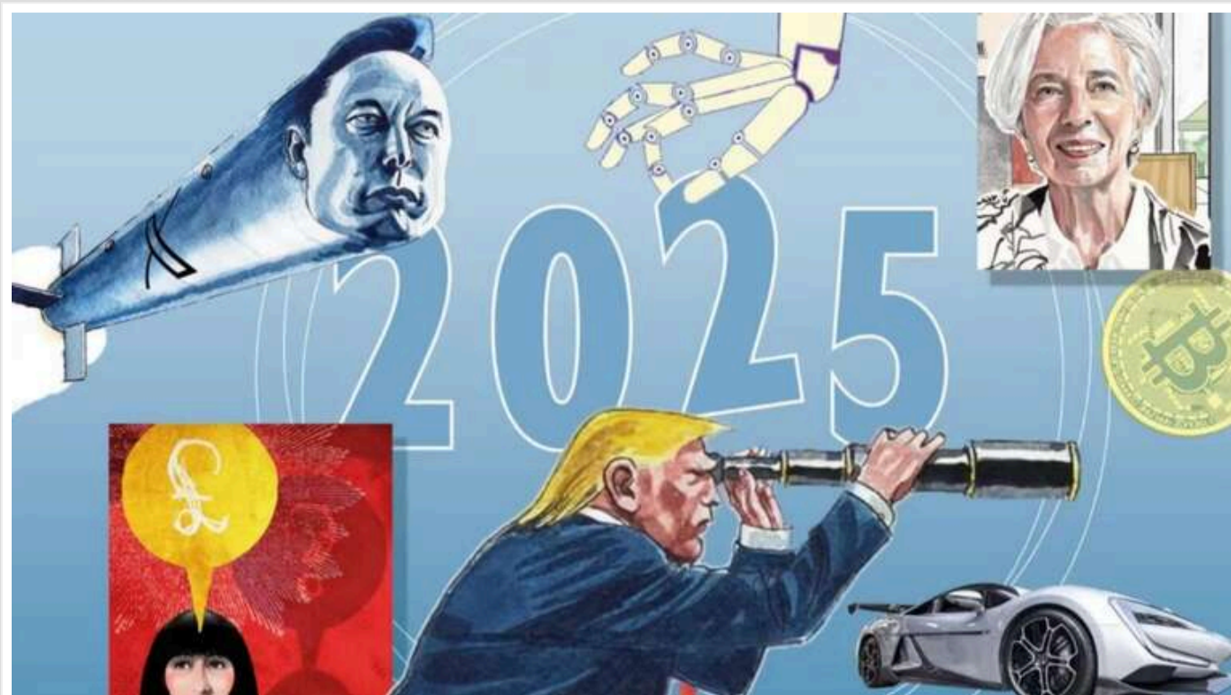
Прогнози Financial Times на 2025 рік: від злету біткоїна до нової тарифної війни

Видання Financial Times представило свої прогнози на 2025 рік, що охоплюють економіку, технології, політику та міжнародні відносини.