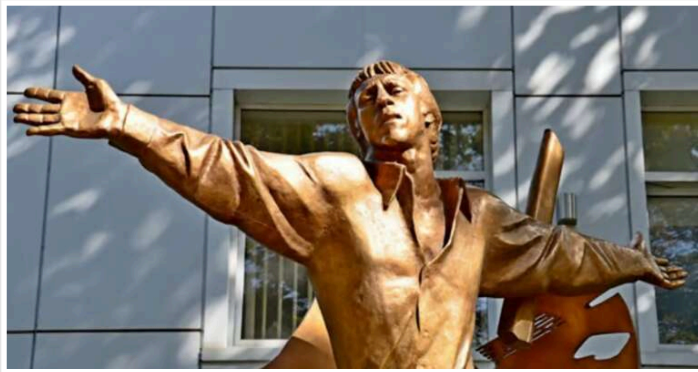
В Одесі знесли пам'ятник Висоцькому: кіностудія хоче зберегти його для встановлення на своїй території

Одеська кіностудія підтвердила демонтаж пам'ятника Володимиру Висоцькому, який стався напередодні о 22:00 за рішенням місцевої влади.