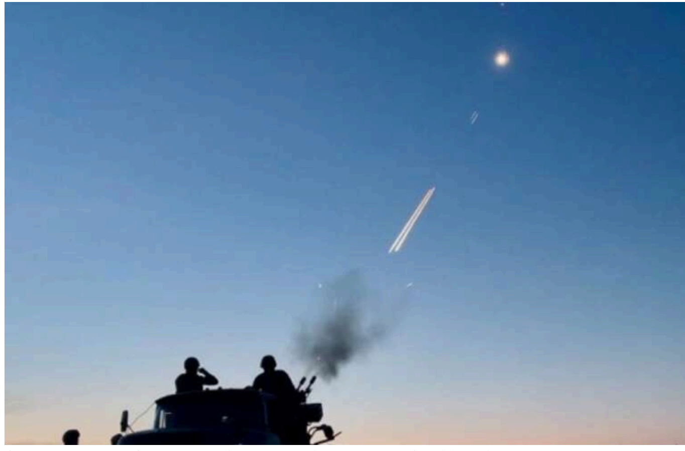
Сили протиповітряної оборони знищили одну ракету «Кинджал», 5 ракет X-69 та 16 «шахедів»

Українські сили оборони знищили одну російську ракету "Кинджал", 5 керованих авіаційних ракет X-69 та 16 ударних безпілотників типу Shahed.