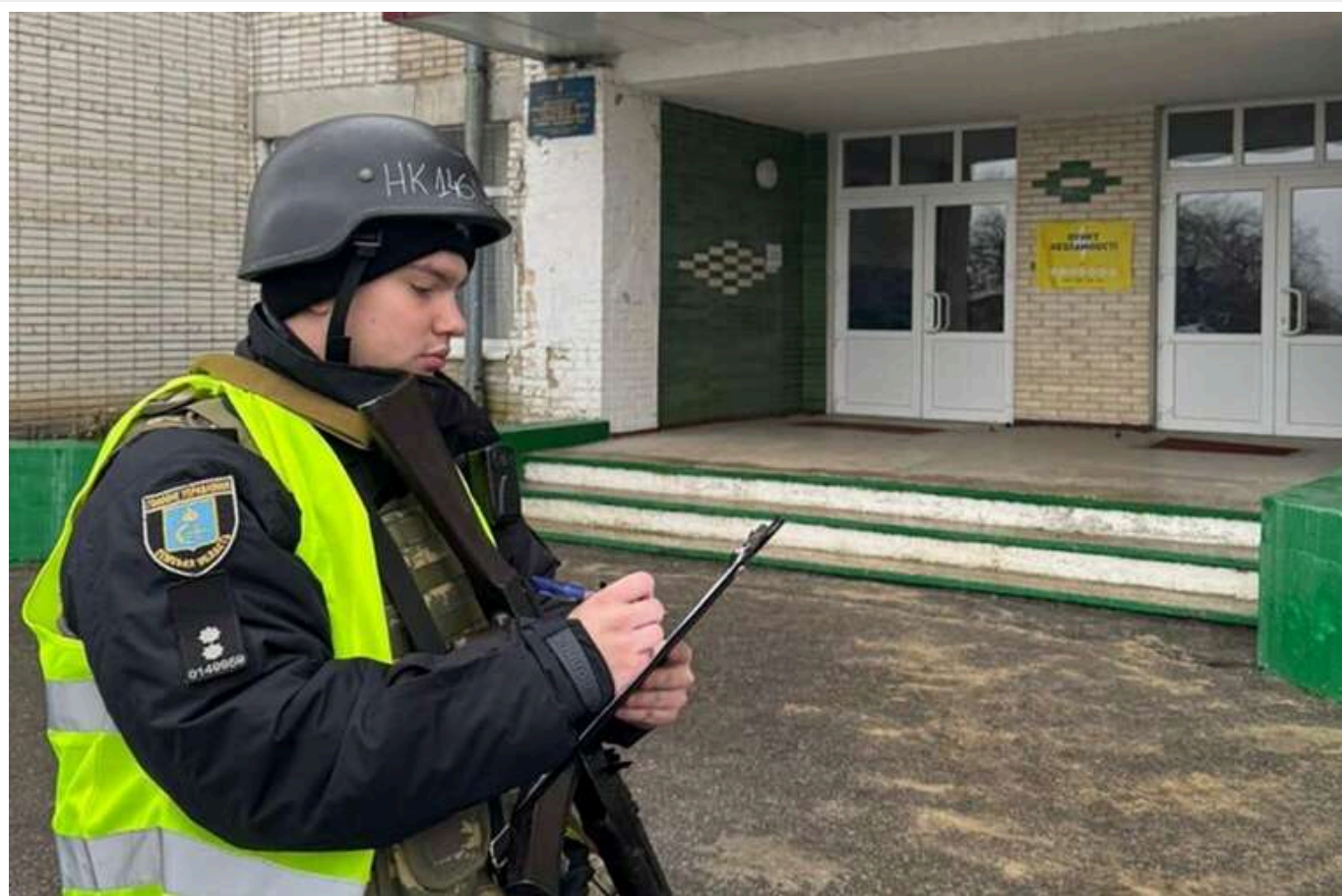
Поліція опублікувала фото наслідків ракетного удару по Шостці

У Шостці під час масованої ракетної атаки сталося 12 вибухів.