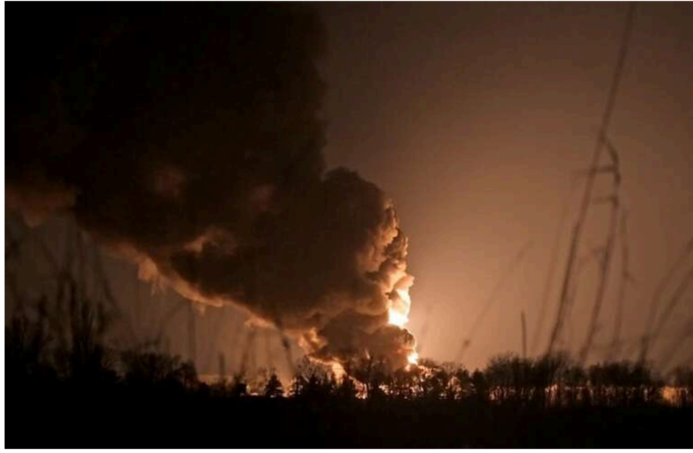
В Одесі пролунала серія вибухів

В Одесі під час повітряної тривоги були звуки вибухів. Громадян просять залишатися в укриттях до завершення тривоги.