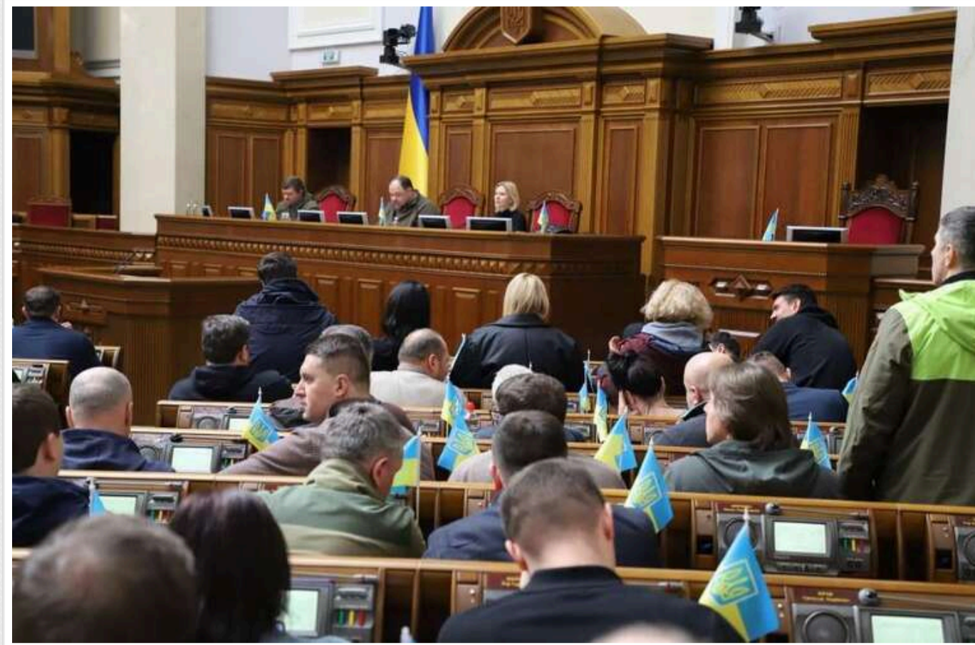
В Україні хочуть дозволити виїзд за кордон студентам до 24 років

Українці віком до 24 років, які отримують відстрочку завдяки навчанню за кордоном, побоюються повертатися в Україну, повідомили народні депутати. Тому вони пропонують змінити закони і таким чином поліпшити демографічну ситуацію.