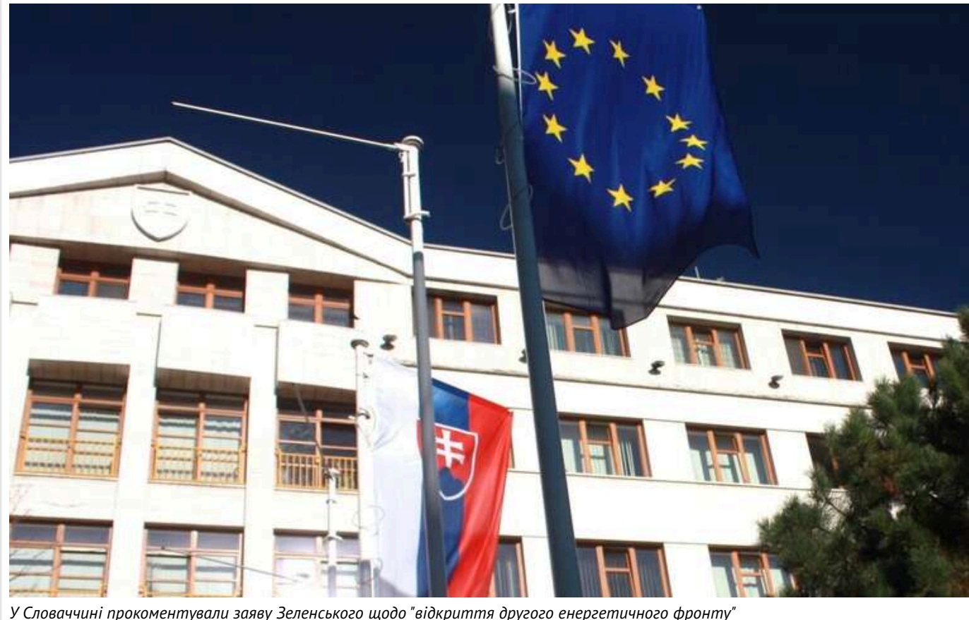
У Словаччині прокоментували заяву Зеленського щодо "відкриття другого енергетичного фронту"

Міністерство закордонних справ Словаччини відреагувало на заяву президента Володимира Зеленського, в якій він стверджував, що "Путін доручив Фіцо відкрити другий енергетичний фронт проти України".