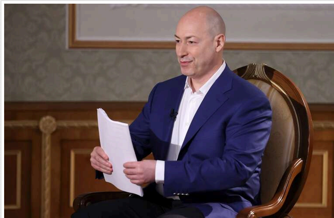
Прогноз про завершення гарячої фази війни: Гордон заявив, що переговори між російською та американською делегацією нічим добрим не закінчилися

«За моїми даними з Вашингтона, переговори між російською та американською делегаціями не привели до позитивних результатів. РФ відмовилася припинити бойові дії та вимагала повної денацифікації України», – Гордон.