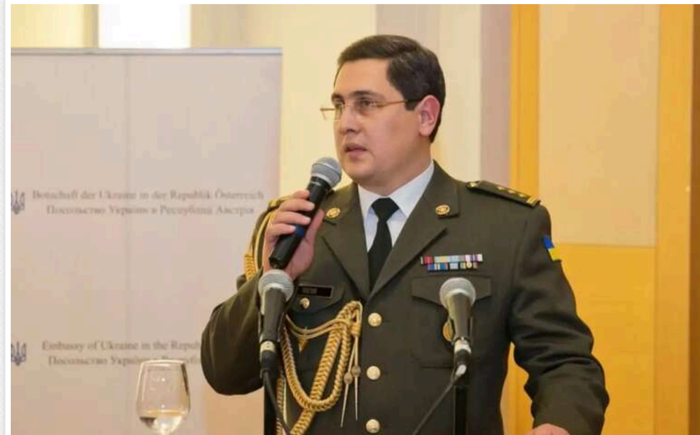
Син генерала Ткачука декларує мільйонні статки: ДТП в Австрії, посада аташе, мільйони на рахунках

Генерал Павло Ткачук неодноразово потрапляв у центр гучних скандалів, зокрема корупційних. У той же час його син, Андрій Ткачук, мав мільйонні статки на рахунках, займаючи посаду військового аташе в Австрії.