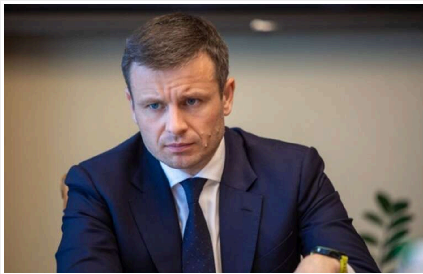
У Мінфіні розповіли, чому підвищили податки в Україні

Уряд був змушений підняти податки в Україні для фінансування армії, оскільки обсяги внутрішніх запозичень мають певні обмеження.