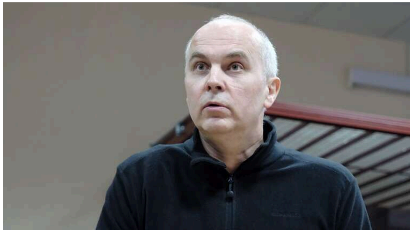
Нардепа Шуфрича не возитимуть із СІЗО на засідання Ради, - ЗМІ

Народного депутата Нестора Шуфрича, якого звинувачують у державній зраді, не будуть доставляти з СІЗО на засідання Верховної Ради. Свої повноваження він може реалізувати шляхом направлення депутатських запитів і звернень, відповідно до рішення Шевченківського райсуду.