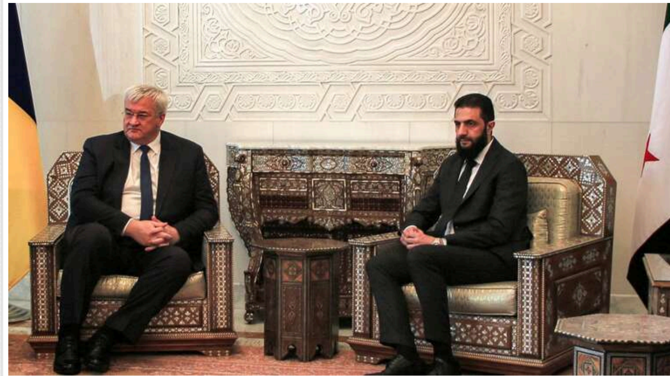
Сибіга поділився подробицями поїздки до Дамаска

Під час візиту до Дамаска, Сирія, керівник Міністерства закордонних справ (МЗС) України Андрій Сибіга провів переговори з представниками сирійської адміністрації, лідером країни Ахмадом аш-Шараа та іншими.